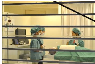
上: 腹腔鏡手術の体験/下: 救急車

下の写真は、当クリニックが「Kids in Oita」を始めるきっかけになった甲子園"キッザニア"の風景です。本格的で、とても素晴らしいイベントでした。