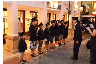
警察署と消防署の体験