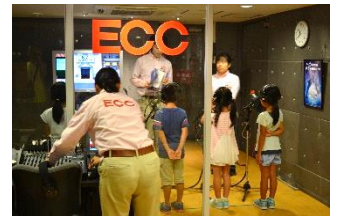
上: 英語吹き替え/下: お寿司体験