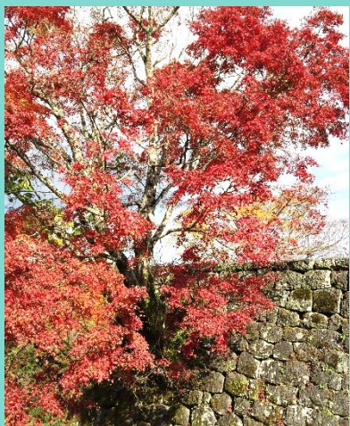
今月の1枚 岡城の紅葉