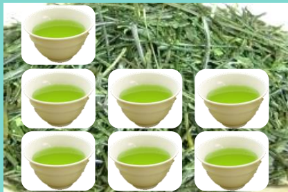
「1日の摂取量の上限(目安)」