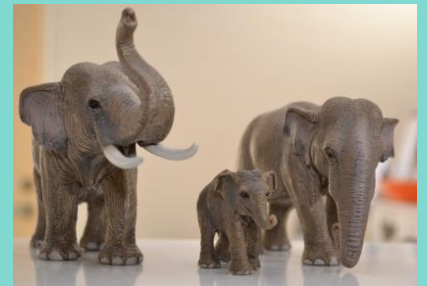
「受付カウンターのインド象」