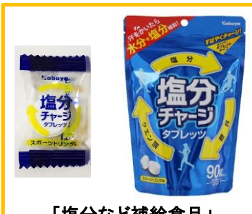
「塩分など補給食品」

熱中症は予防が大事です。日中は出来るだけ涼しいところで過ごし、水分もこまめに摂取しましょう。経口補水液、スポーツ飲料、塩分補給食品は、熱中症予防にも有用です。