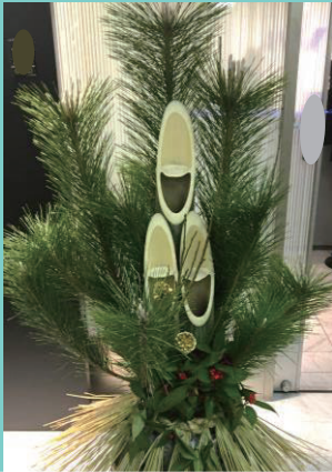
今月の1枚 「謹賀新年」