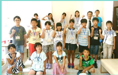
これまでの「Kids in Oita」の写真