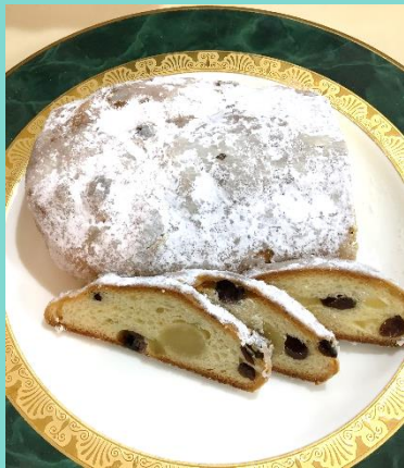
今月の1枚 クリスマスを祝って「シュトーレン」