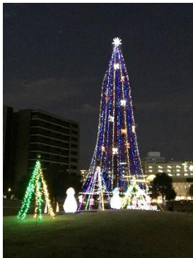
ホルトホール前のイルミネーション