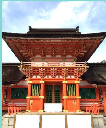
今月の1枚 幸先詣 「宇佐神宮」