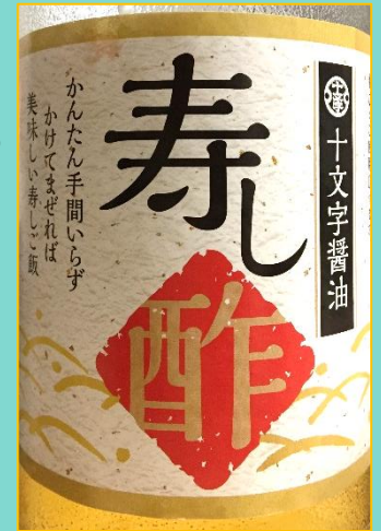
十文字醤油「寿司酢」