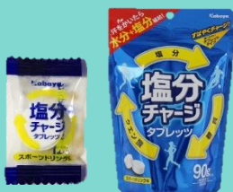
「塩分など補給食品」

受付に、熱中症予防のための厚生労働省のリーフレットがあります。是非、ご参照ください。