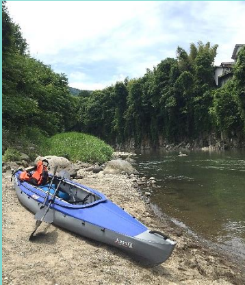
今月の1枚 三日月の滝公園と愛艇