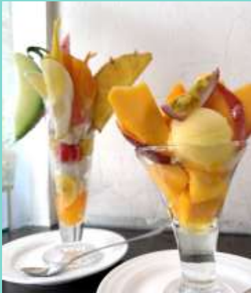
今月の1枚 「フルーツパフェ」