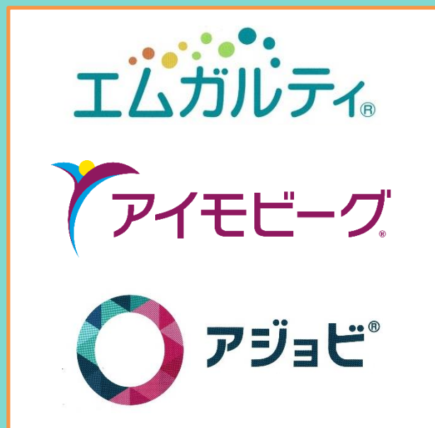
「3種類の CGRP 治療薬」