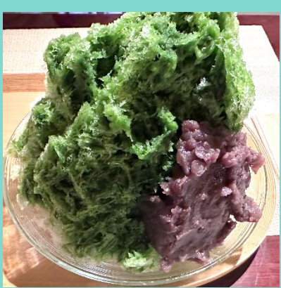
今月の1枚 「宇治金時」