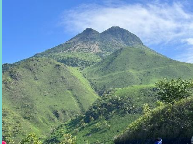
今月の1枚 「快晴の由布岳」