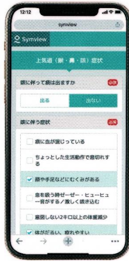
● 問診利用イメージ

5月より運用を開始しております スマートフォンを用いたWEB問診 です。おかげさまで、大きな混乱も なく経過しております。