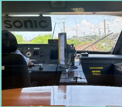
「車窓からみた入道雲」