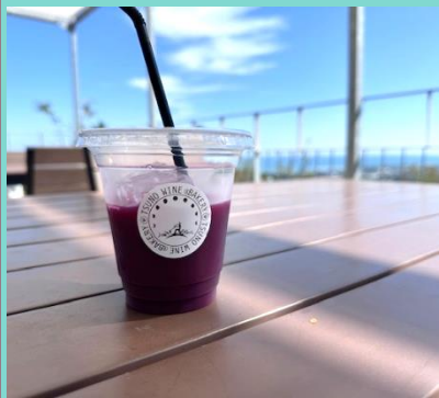
「都農ワイナリーの ぶどうジュース」