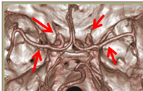
矢印は脳の動脈です。 頭のとっぺんからの見え方です。

なお、当日の準備のため、予約制とさせていただきます。参加ご希望の方は、お申込み用紙にご記入をお願いします。