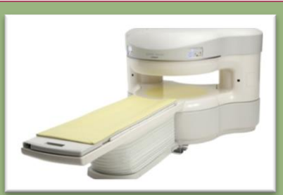
クリニックの機器: 「永久磁石オープンMRI」