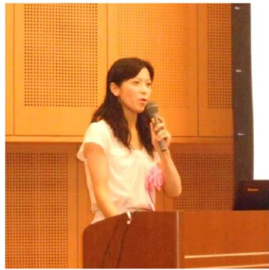
「講演中のさとみ先生」